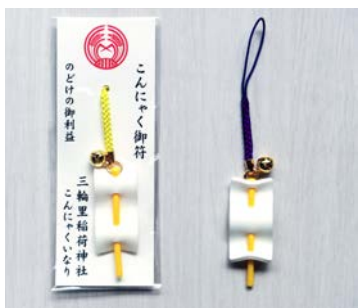
こんにく御符お守り